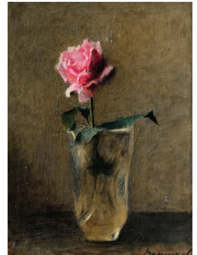
16 «Самотня троянда», 2006 Полотно, олія 40,5 x 30,5 см Підпис знизу праворуч

"Still Life with Grapes", 2000s Oil on cardboard 30 x 40 cm Signature top right