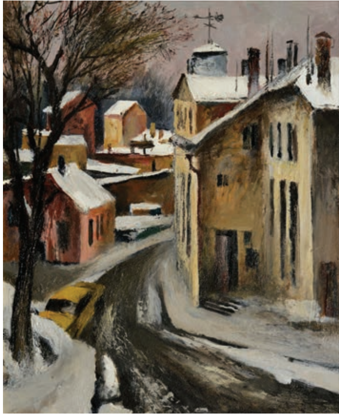
48 «Відлига в Сигулді», 1979 Полотно, олія 45 x 37 см Підпис і дата знизу праворуч