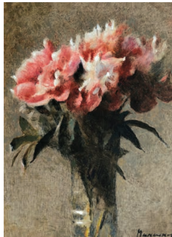
20 «Натюрморт з півоніями», 2000-і Картон, олія 39,5 x 29 см Підпис знизу праворуч