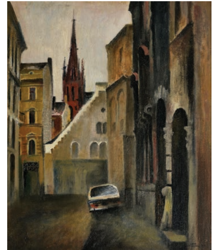
53 «Вулицями Риги», 1979 Полотно, олія 45 x 37 см Підпис і дата знизу праворуч