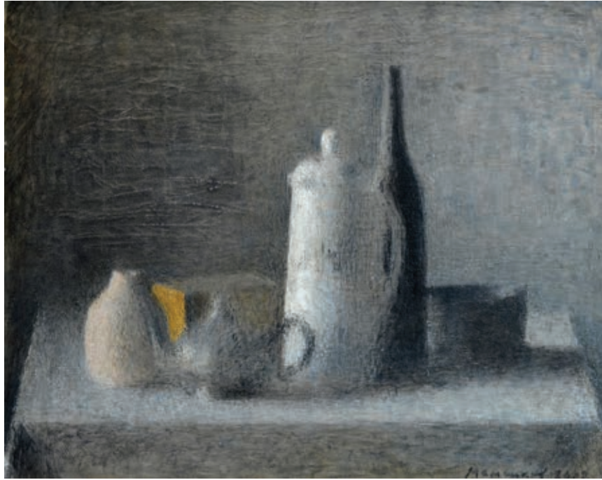
1 «Сірий натюрморт», 2002 Полотно, олія 40 x 50 см Підпис в дата знизу праворуч