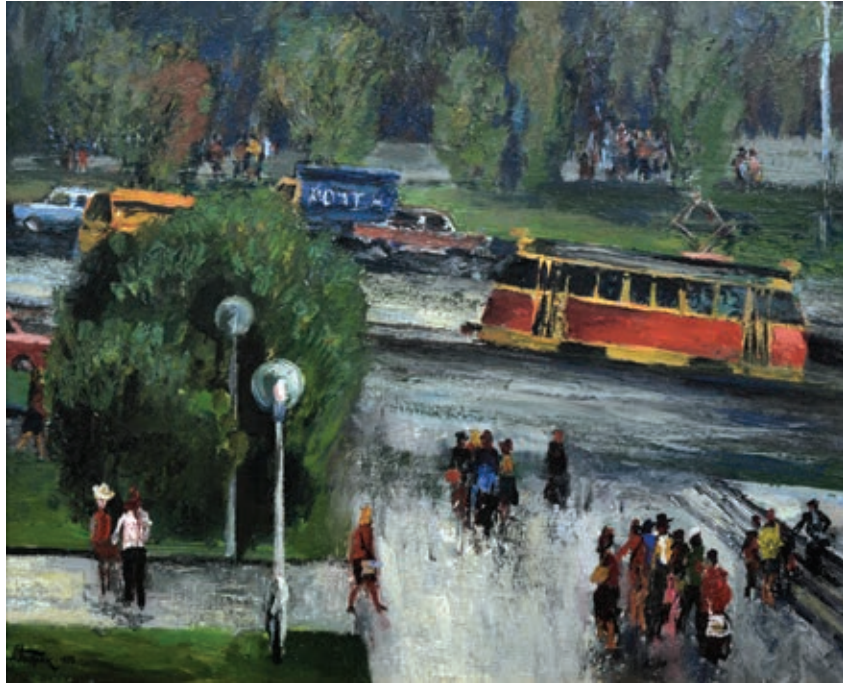
34 «Червоний трамвай», 1980 Картон, олія 39 x 47 см Підпис і дата знизу ліворуч