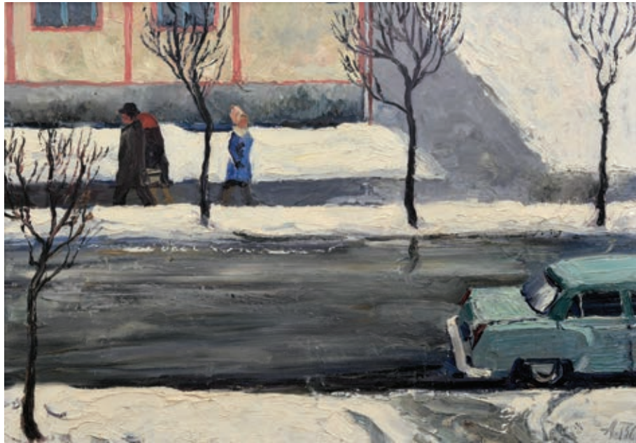
42 «Мокра зима», 1966 Картон, олія 50 x 70 см Підпис і дата знизу праворуч

"Wet winter", 1966 Oil on cardboard 50 x 70 cm Signature and date bottom right