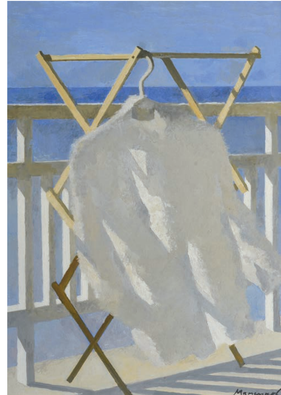
18 «Ранок на о. Барбадос», 2007 Картон, олія 70 x 50 см Підпис знизу праворуч