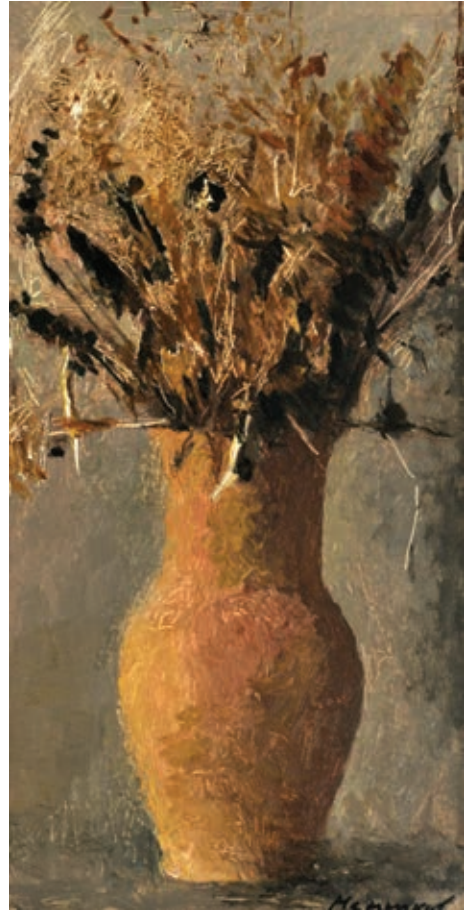
4 «Глечик з будяками», 2005 Картон, олія 40 x 21 см Підпис знизу праворуч