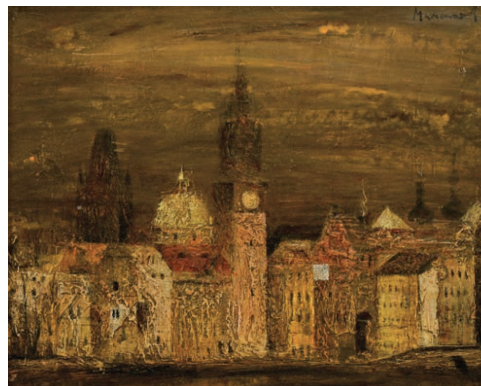
24 «Прага», 1998 Полотно, олія 40 x 50 см Підпис знизу праворуч