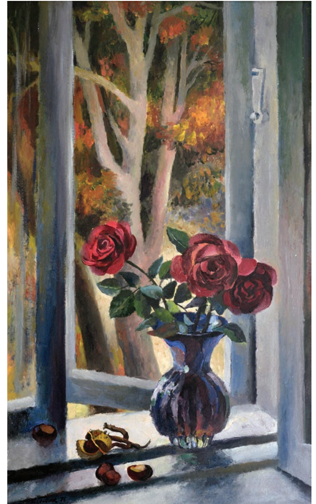
44 «Червоні троянди», 1976 Картон, олія 80 x 50 см Підпис і дата знизу ліворуч

"State farm pantry", 1971 Tempera on cardboard 47 x 67,5 cm Signature and date bottom right