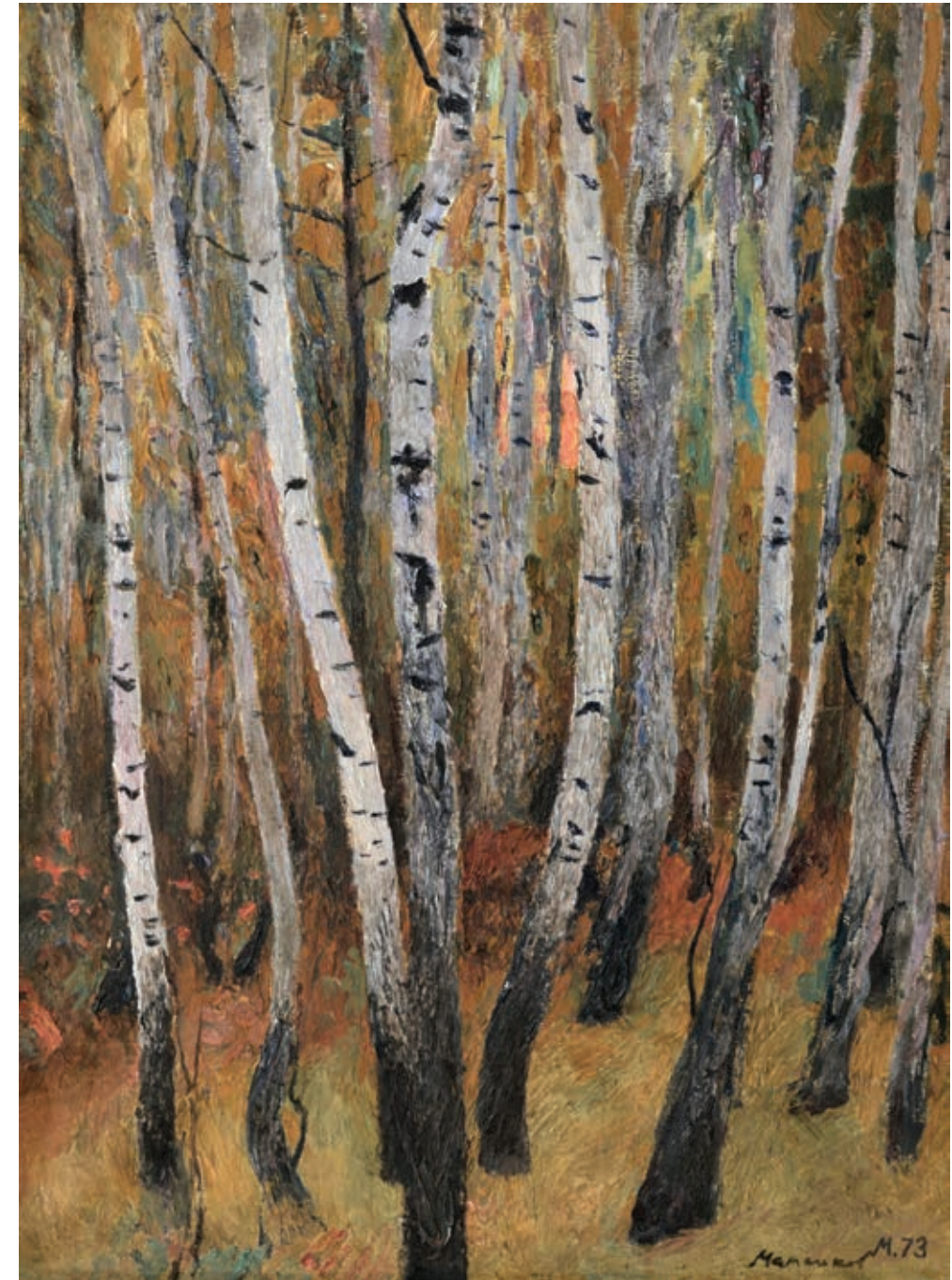
27 «Березовий гай», 1973 Полотно, олія 80 x 60 см Підпис і дата знизу праворуч