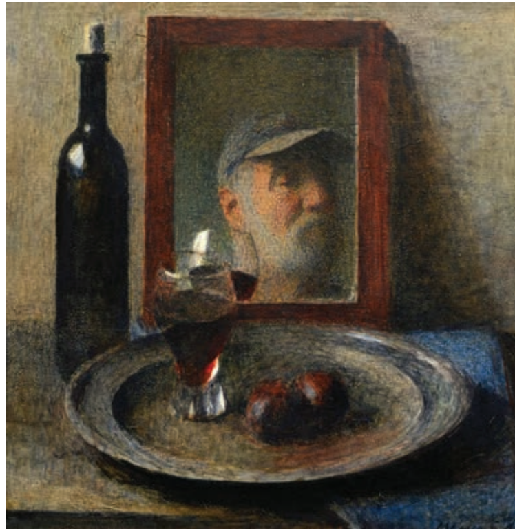
19 «Автопортрет», 2000-і ДСП, олія 46,5 x 46 см Підпис знизу праворуч