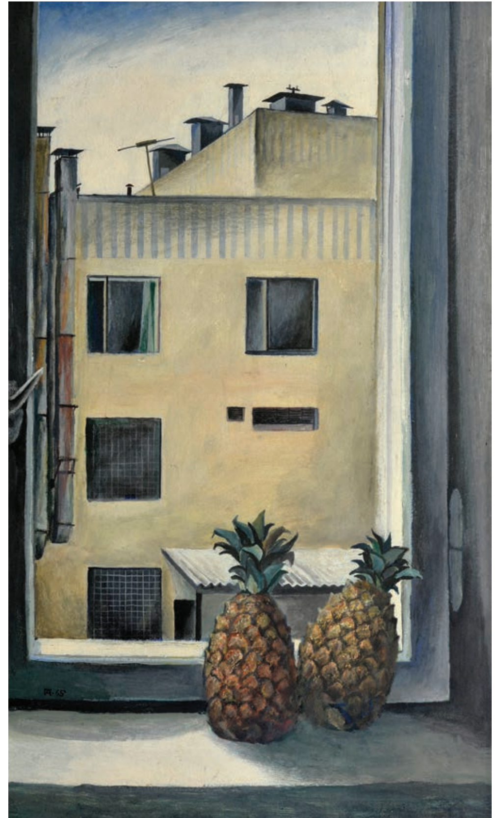
"Pineapples", 1965 Tempera on cardboard 80 x 50 cm Signature and date bottom left