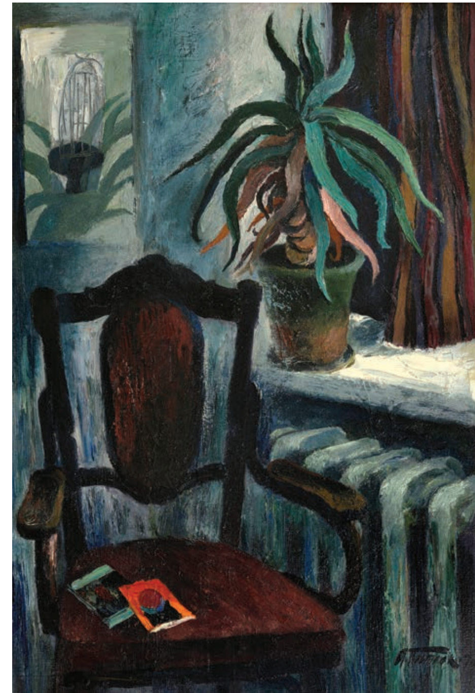
38 «Кактус», 1976 Картон, масло 70 x 50 см Підпис і дата знизу праворуч