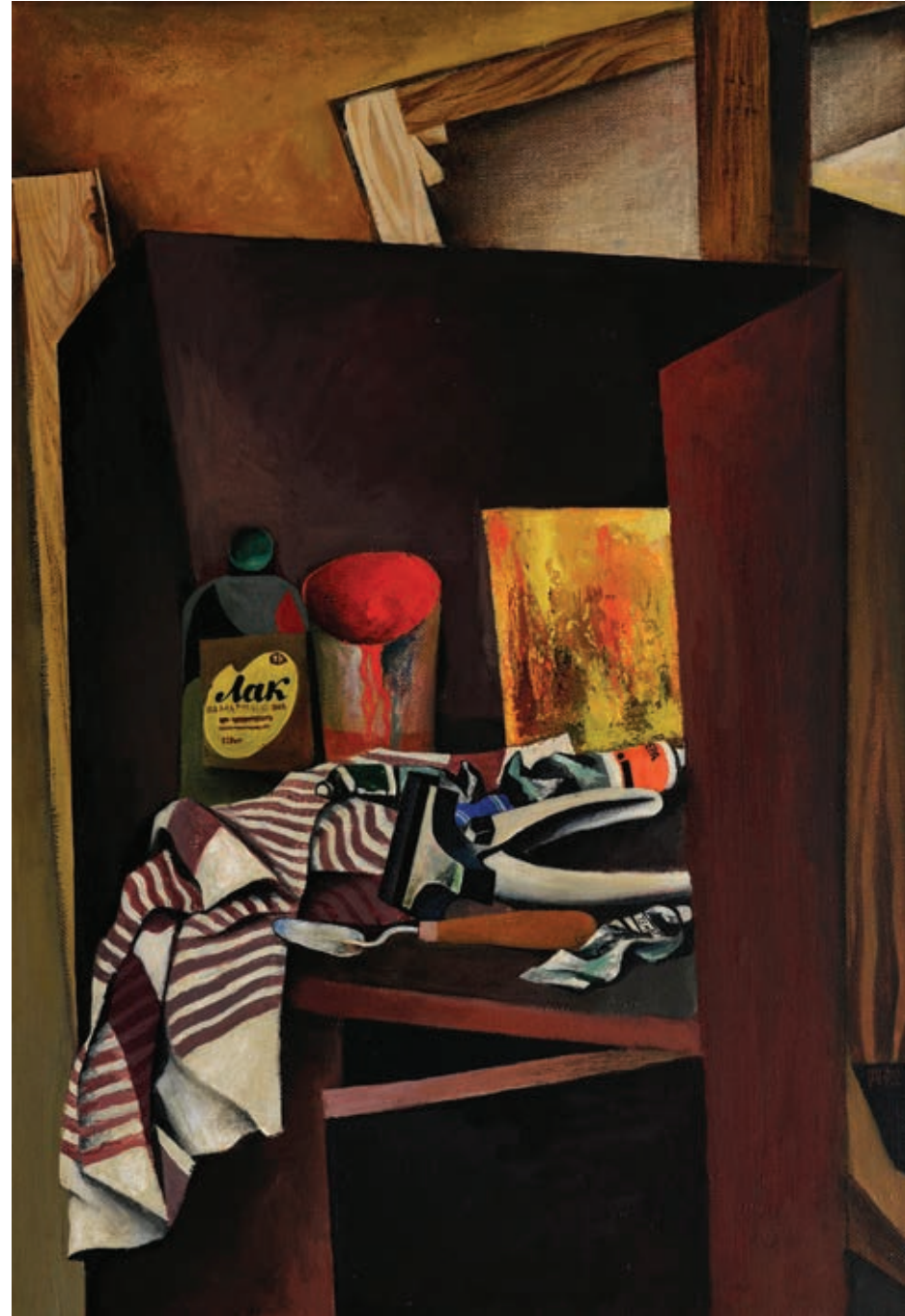
45 «Натюрморт. Фарби», 1972 Полотно, темпера 66 x 48 см Підпис і дата знизу праворуч