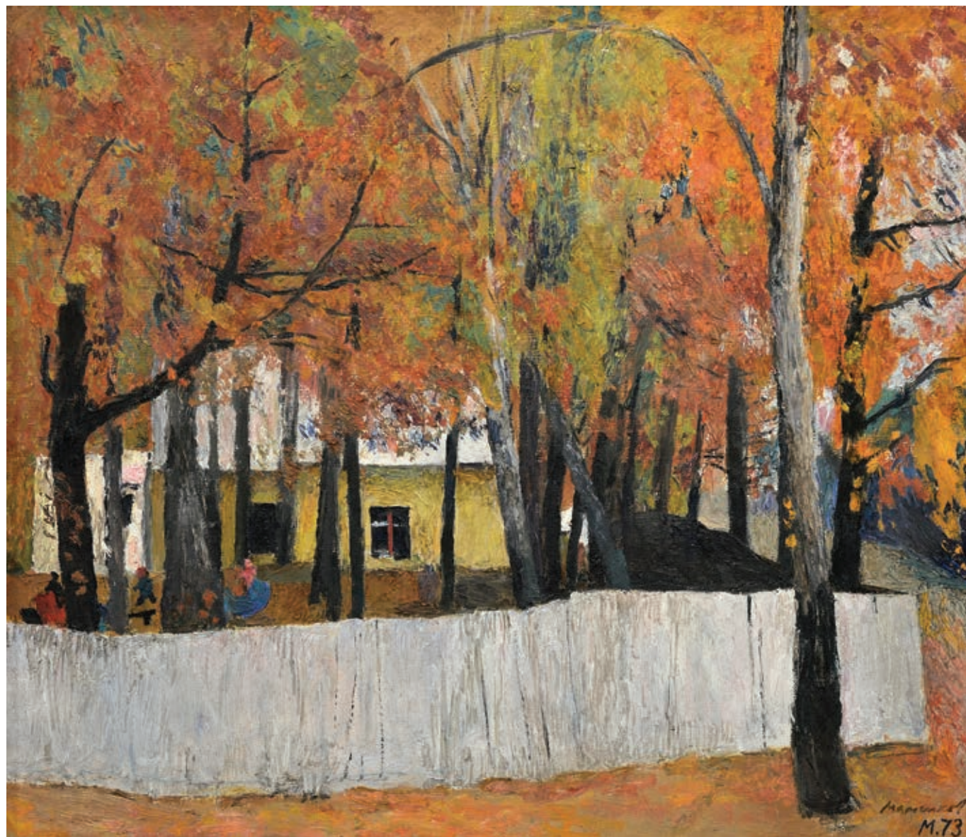
10 «Дитячий садок», 1973 Полотно, олія 70 x 80 см Підпис і дата знизу праворуч

"Kindergarten", 1973 Oil on canvas 70 x 80 cm Signature and date bottom right