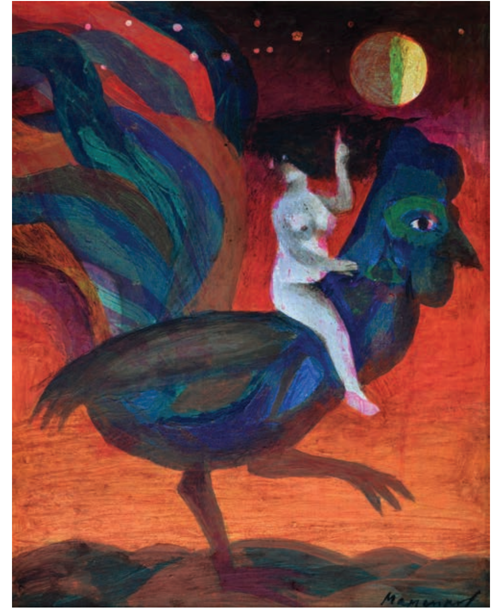
6 «Вечір», 2004 Полотно, олія 50 x 40 см Підпис знизу праворуч