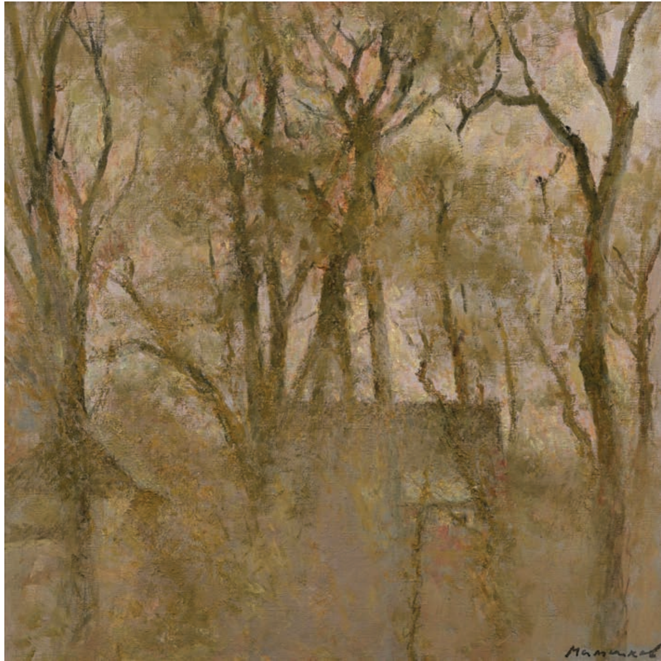
12 «Початок весни», 2005 Полотно, олія 60 x 60 см Підпис знизу праворуч