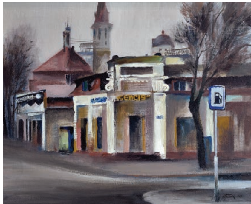
"Dzintari", 1979 Oil on canvas 37 x 45 cm Signature and date bottom right