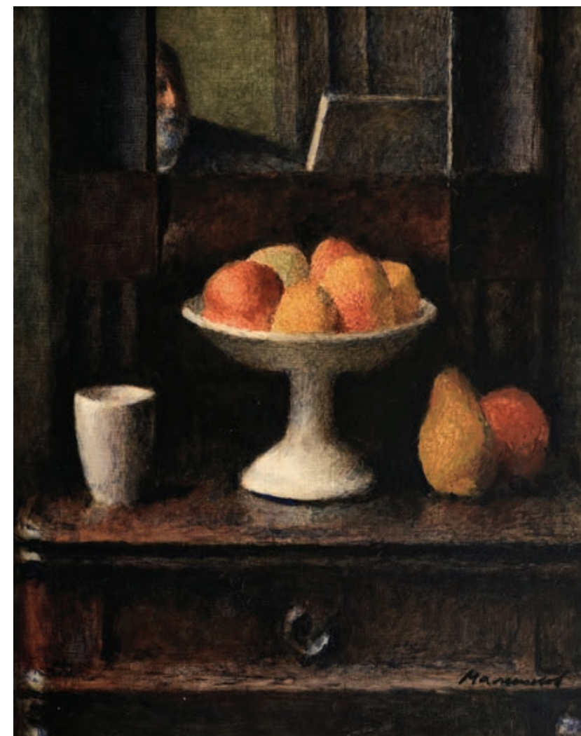
11 «Натюрморт із фруктами та дзеркалом. Автопортрет», 2000-і Полотно, олія 50 x 40 см Підпис знизу ліворуч

"Kindergarten", 1973 Oil on canvas 70 x 80 cm Signature and date bottom right