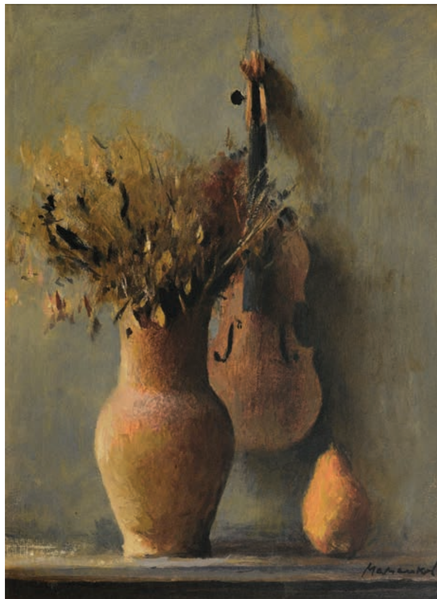
22 «Натюрморт зі скрипкою та грушею», 2000-і Картон, темпера 40 x 30 см Підпис знизу праворуч