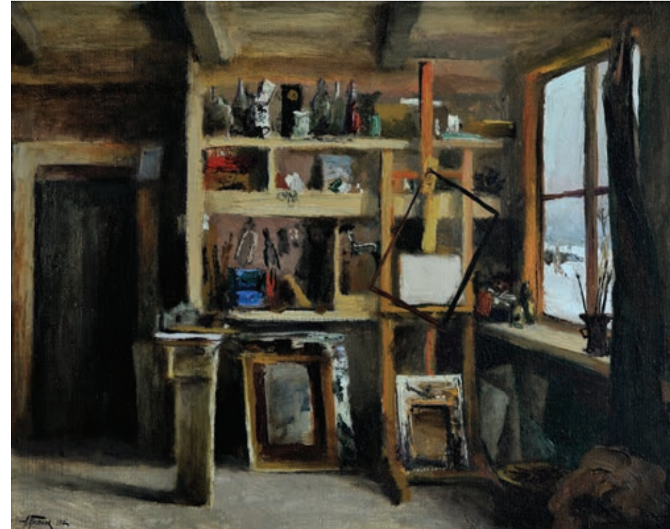
32 «Майстерня», 1987 Полотно, олія 40 x 50 см Підпис і дата знизу ліворуч