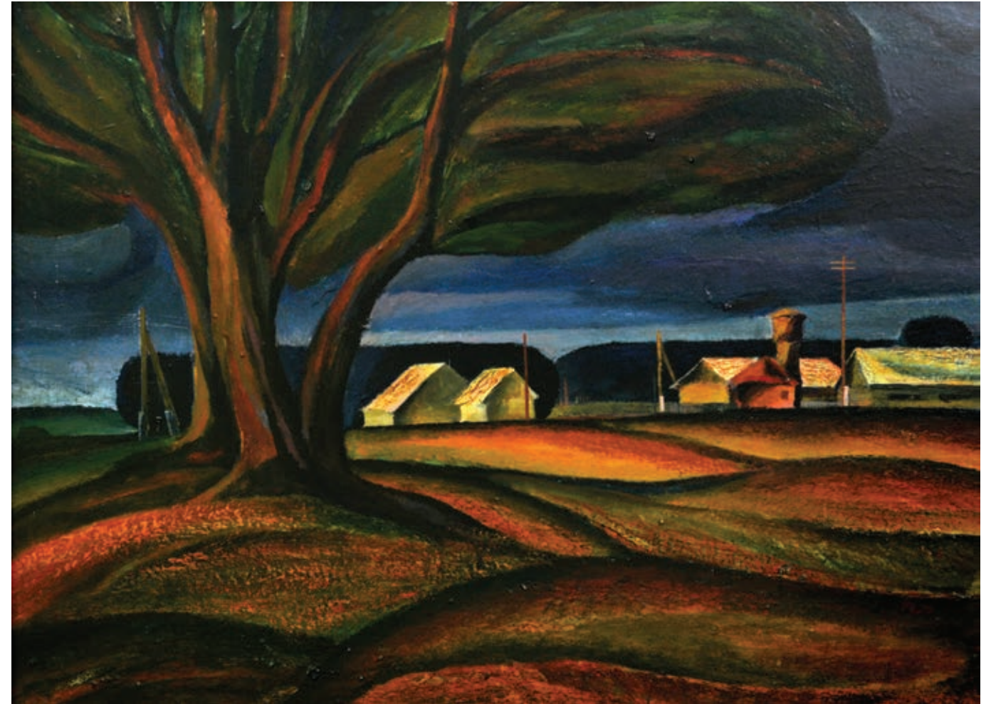
30 «Ферми радгоспу», 1970 Картон, темпера 50 x 68 см Підпис і дата на звороті