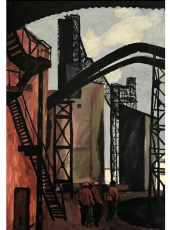
"Miners", 1971 Tempera on cardboard 70 x 50 cm Signature and date bottom left