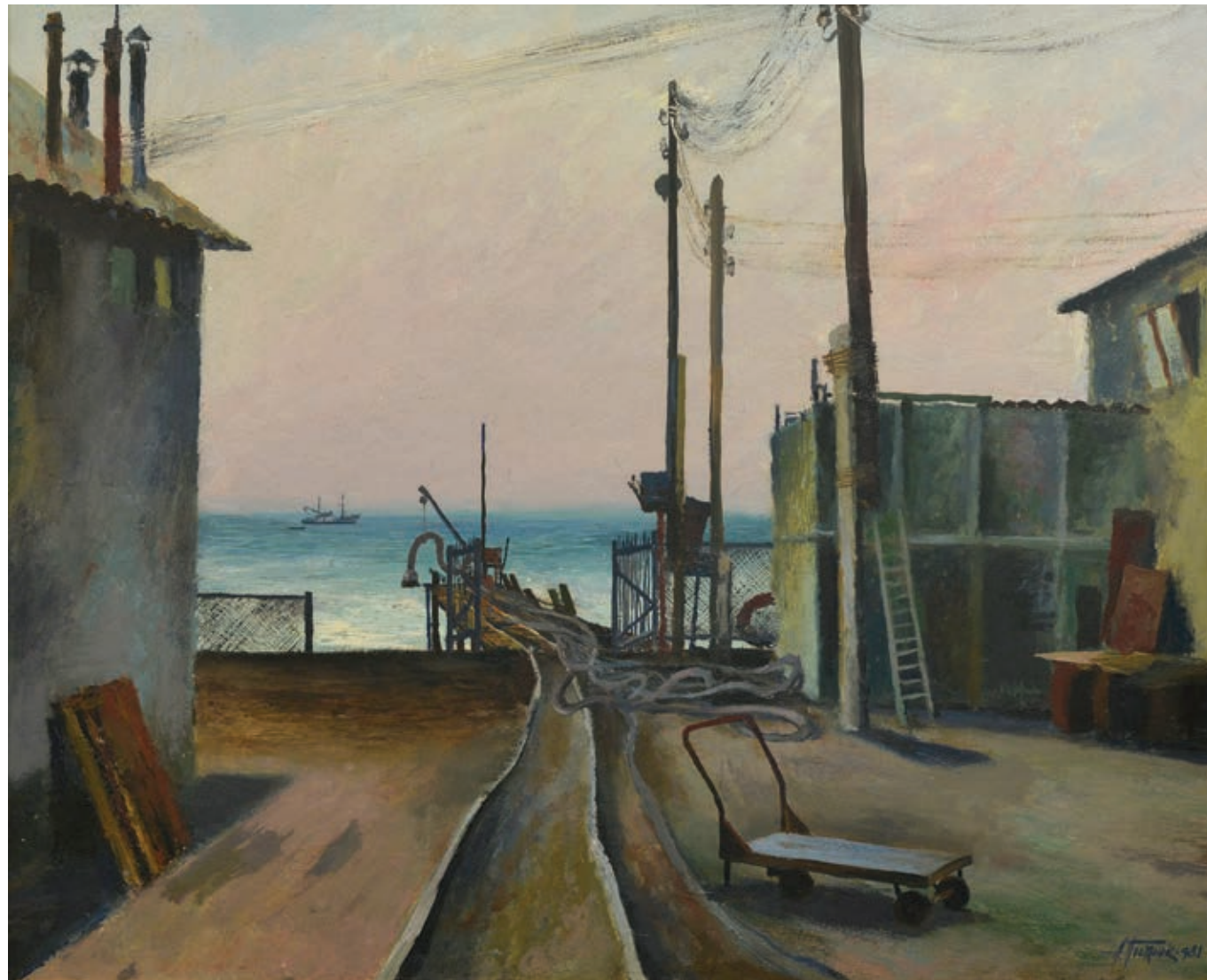
51 «Путіна», 1981 Картон, олія 49,5 x 60 см Підпис і дата знизу ліворуч