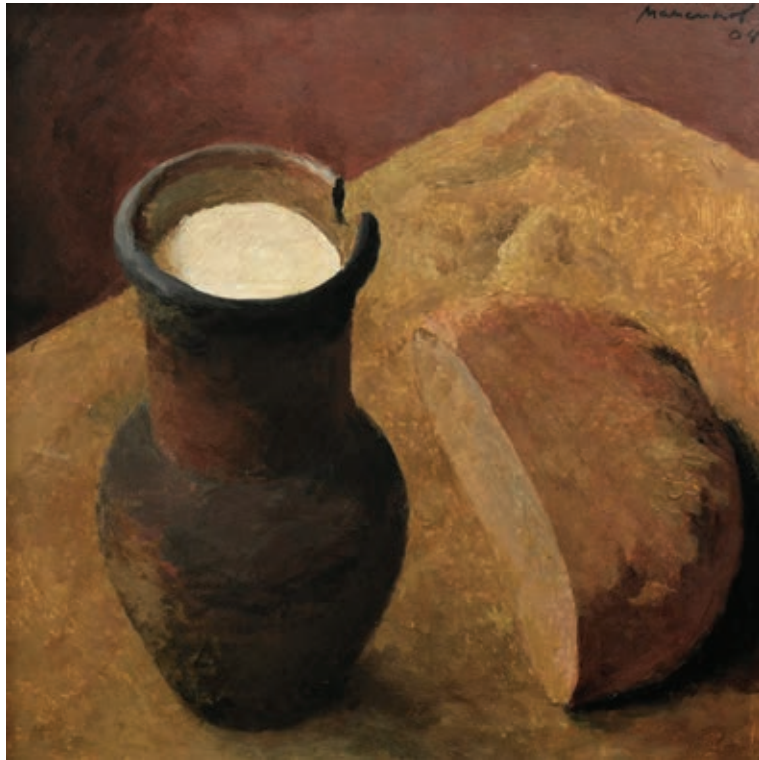
25 «Хліб та молоко», 2004 Картон, олія 50 x 50 см Підпис і дата зверху праворуч