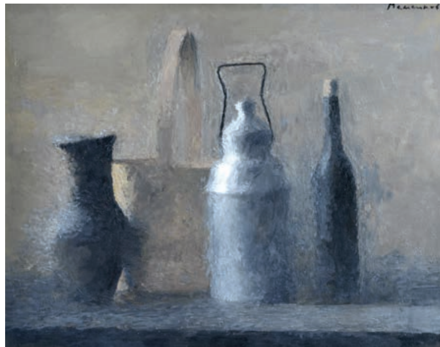
2 «Натюрморт з бідоном», 2004 Полотно, олія 40 x 50 см Підпис зверху праворуч