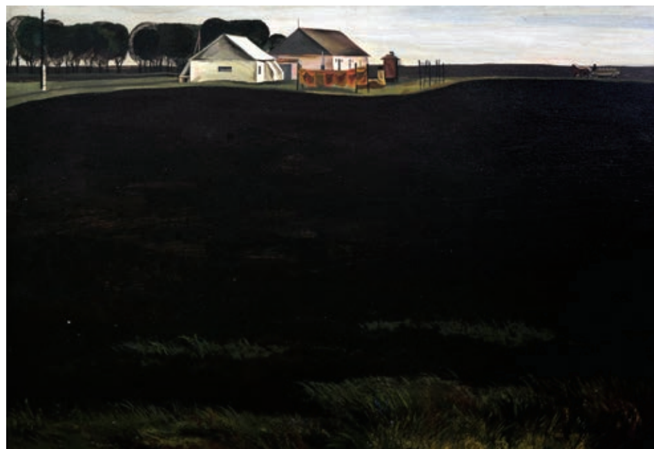
43 «Колгоспна комора», 1971 Картон, темпера 47 x 67,5 см Підпис і дата знизу праворуч

"Wet winter", 1966 Oil on cardboard 50 x 70 cm Signature and date bottom right