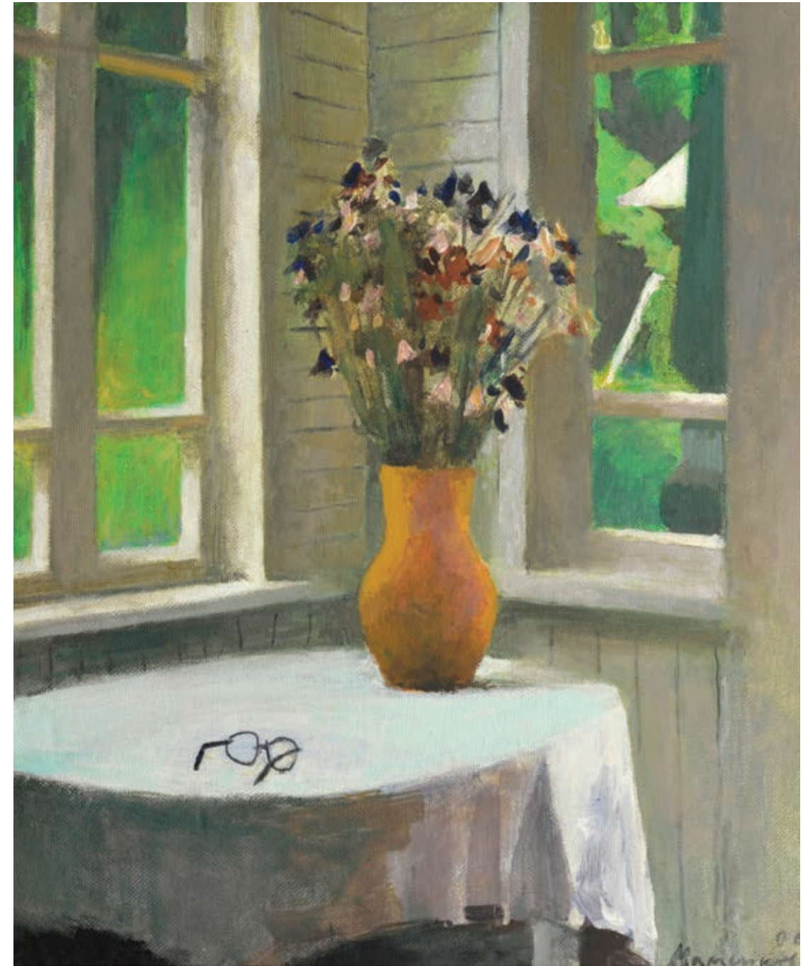
13 «Окуляри», 2006 Оргаліт, олія 61 x 50,5 см Підпис і дата знизу праворуч