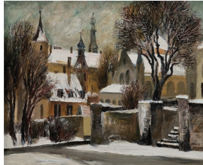
52 «Перший сніг в Ризі», 1979 Полотно, олія 37 x 45 см Підпис і дата знизу праворуч