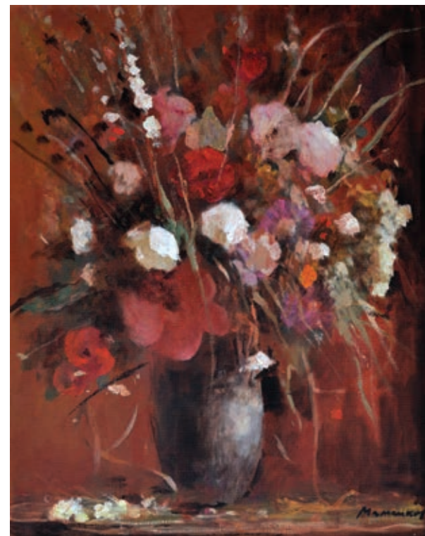
26 «Червоний букет», 2006 Полотно, олія 40 x 50 см Підпис знизу праворуч