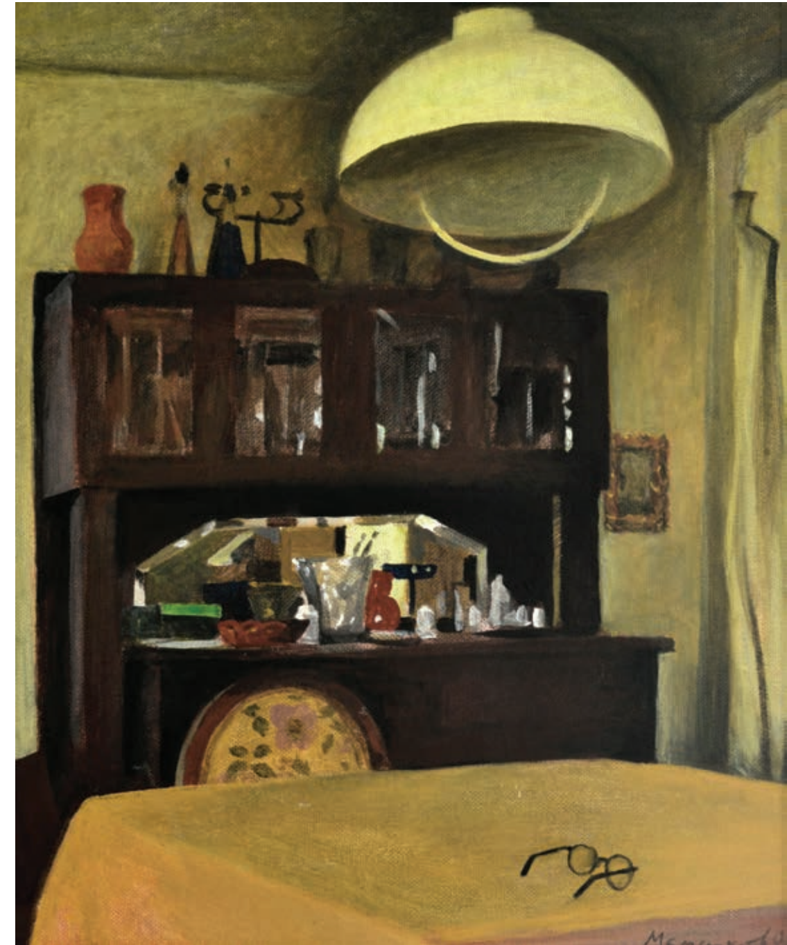
21 «Стара шафа», 2006 Оргаліт, олія 61 x 51 см Підпис і дата знизу праворуч