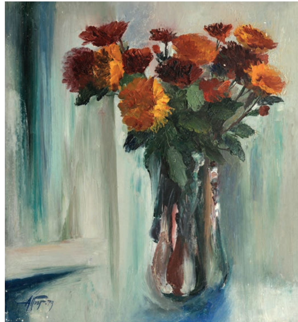
50 «Хризантеми», 1979 Картон, олія 50 x 47 см Підпис і дата знизу ліворуч