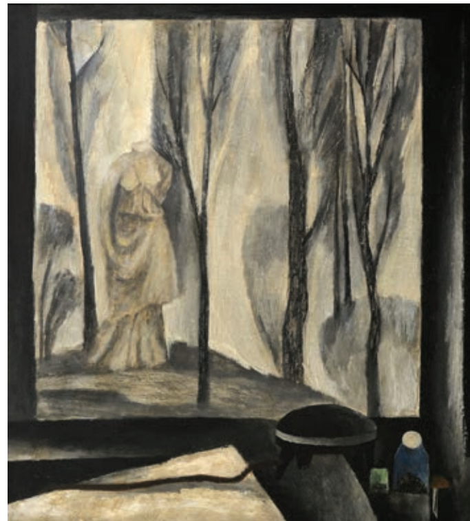
29 «Офортна майстерня», 1972 Картон, темпера 50 x 47 см Підпис і дата на звороті