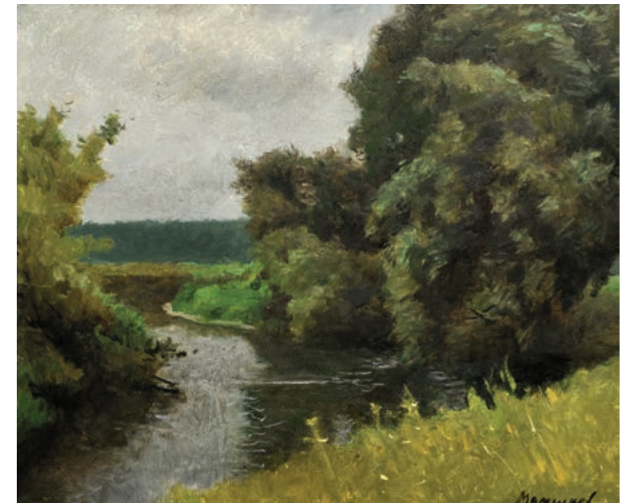
9 «Річка Ірпін»», 2002 Полотно, олія 50 x 60 см Підпис знизу праворуч