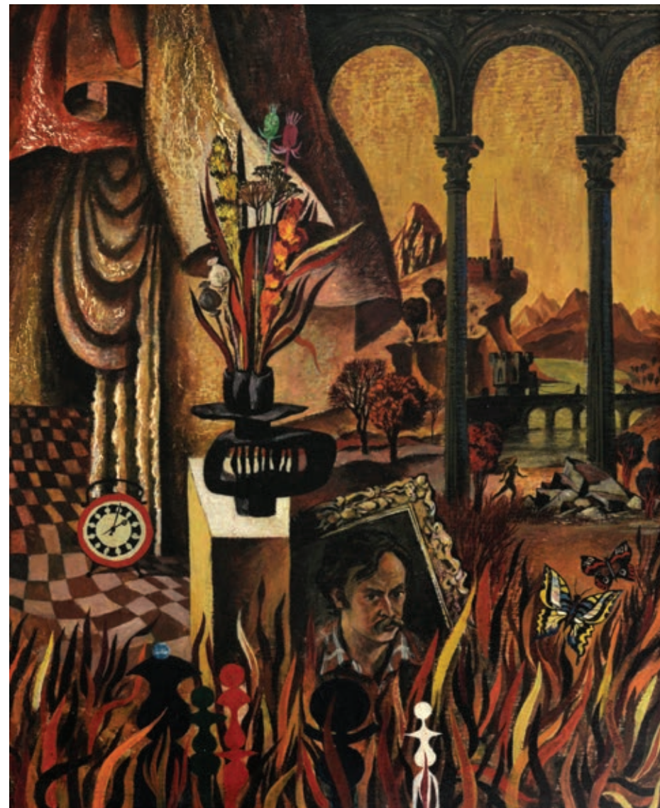
37 «Роздуми», 1976 Картон, темпера 53,5 x 44 см Підпис і дата знизу праворуч