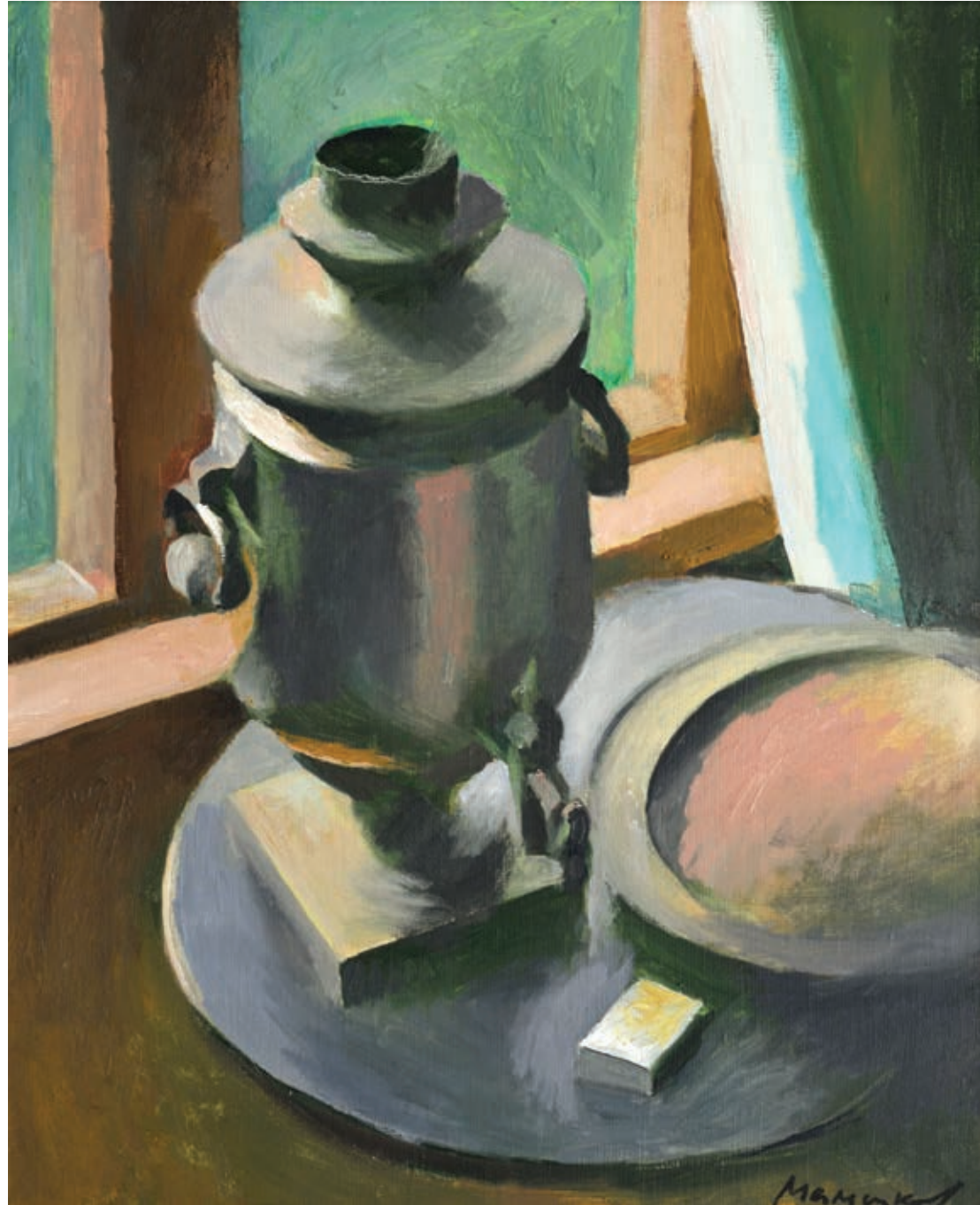
7 «Натюрморт із самоваром», 2000-і Полотно, олія 55 x 45 см Підпис знизу праворуч