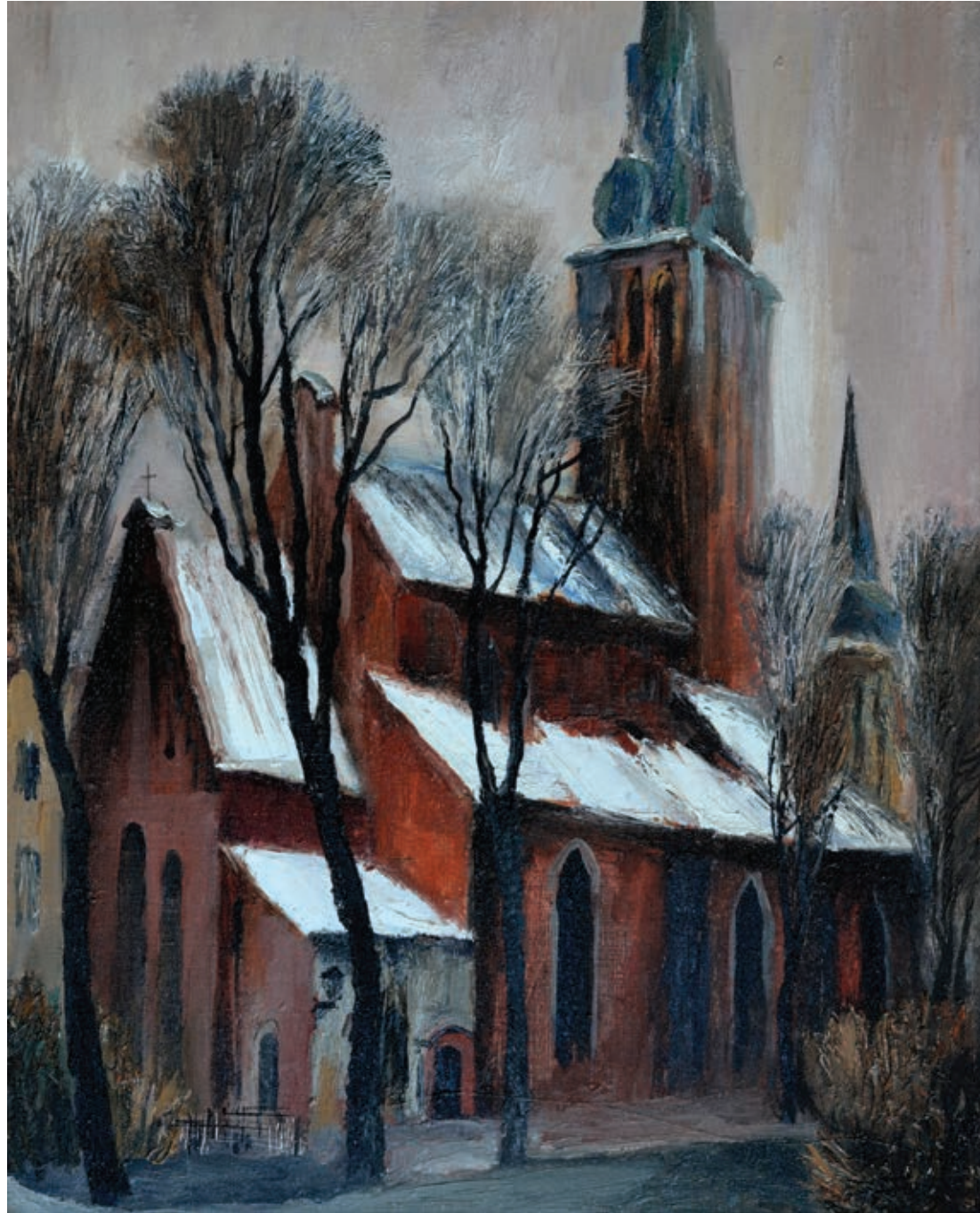
31 «Костел в Ризі», 1979 Полотно, олія 45 x 37 см Підпис і дата знизу праворуч