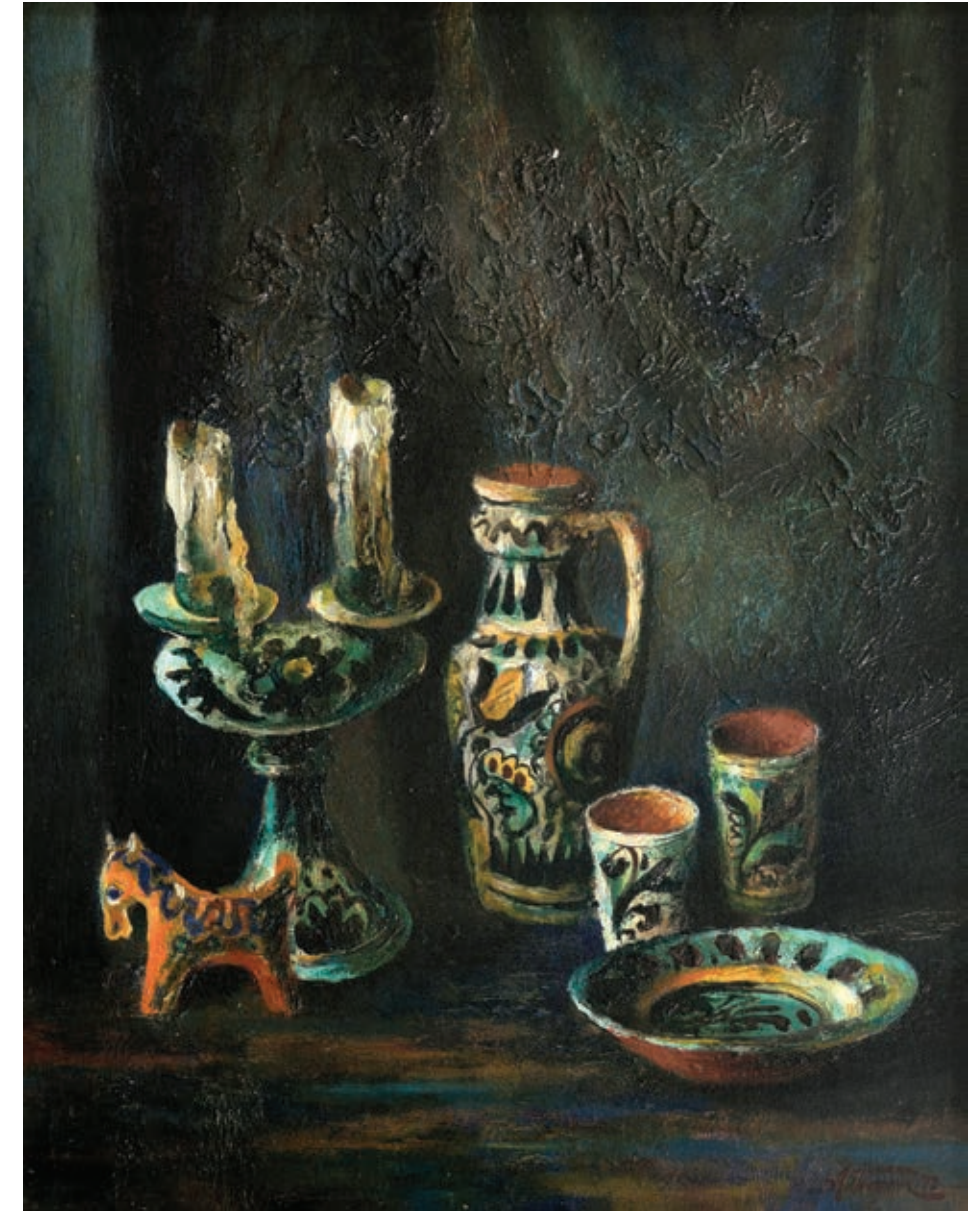
36 «Косівський мотив», 1978 Картон, олія 50 x 40 см Підпис і дата знизу праворуч