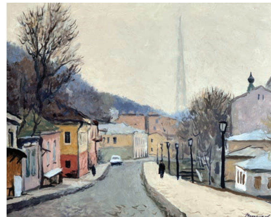
23 «Боричів тік», 1980-і Полотно, олія 40 x 50 см Підпис знизу праворуч