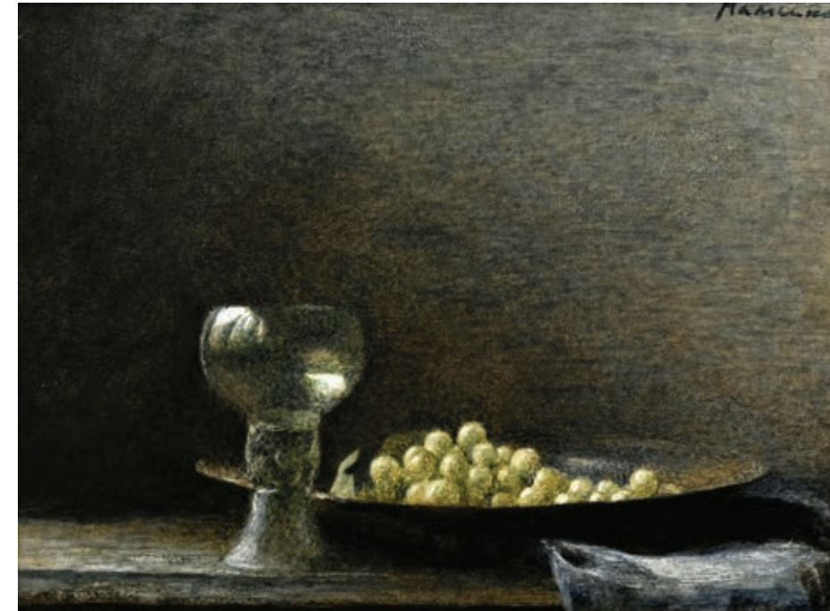
15 «Натюрморт з виноградом», 2000-і Картон, олія 30 x 40 см Підпис зверху праворуч

"Window in the studio", 1980s Oil on cardboard 80 x 50 cm Signature top right