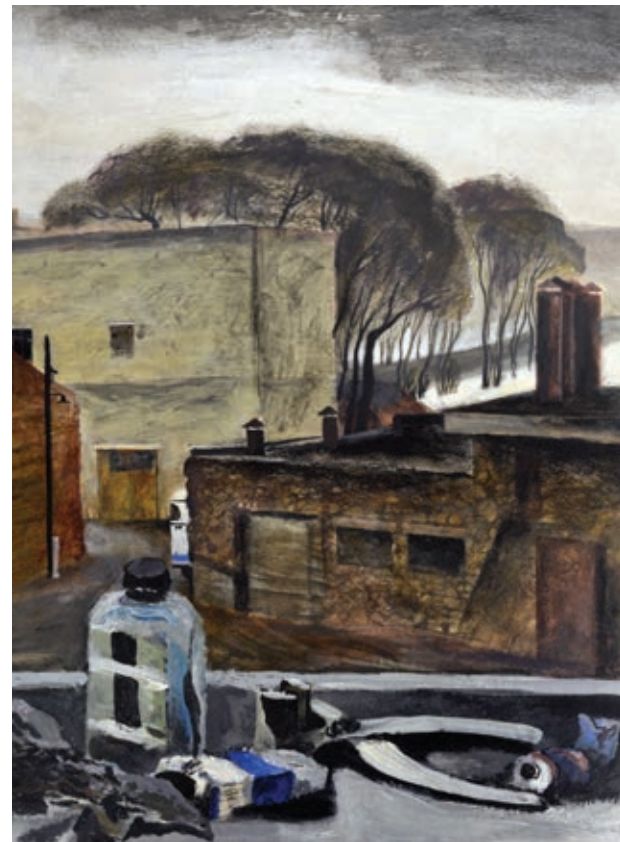
35 «Кочегарка», 1971 Картон, темпера 49,5 x 37 см Підпис і дата знизу праворуч "The Kochegarka", 1971 Tempera on cardboard 49,5 x 37 cm Signature and date bottom right