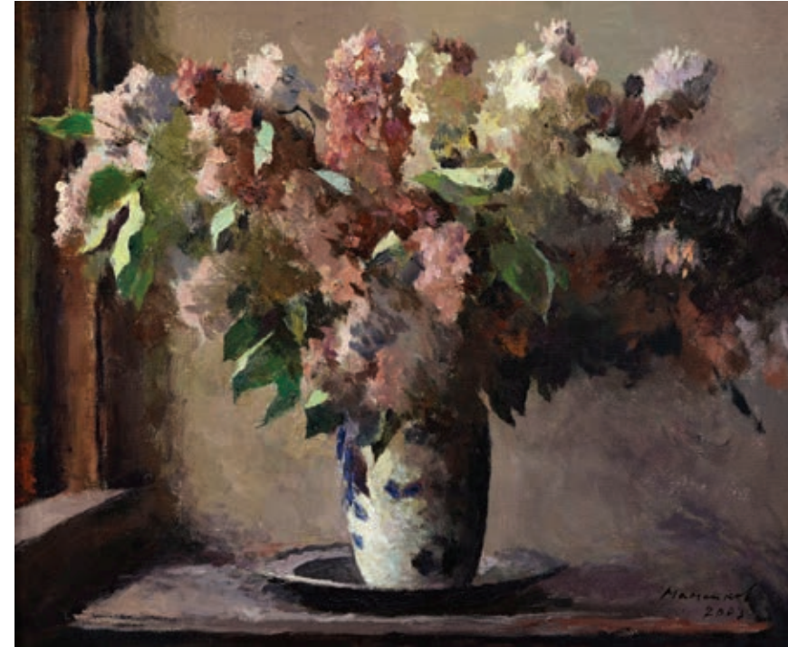
8 «Бузок», 2003 Полотно, олія 50 x 60 см Підпис і дата знизу праворуч