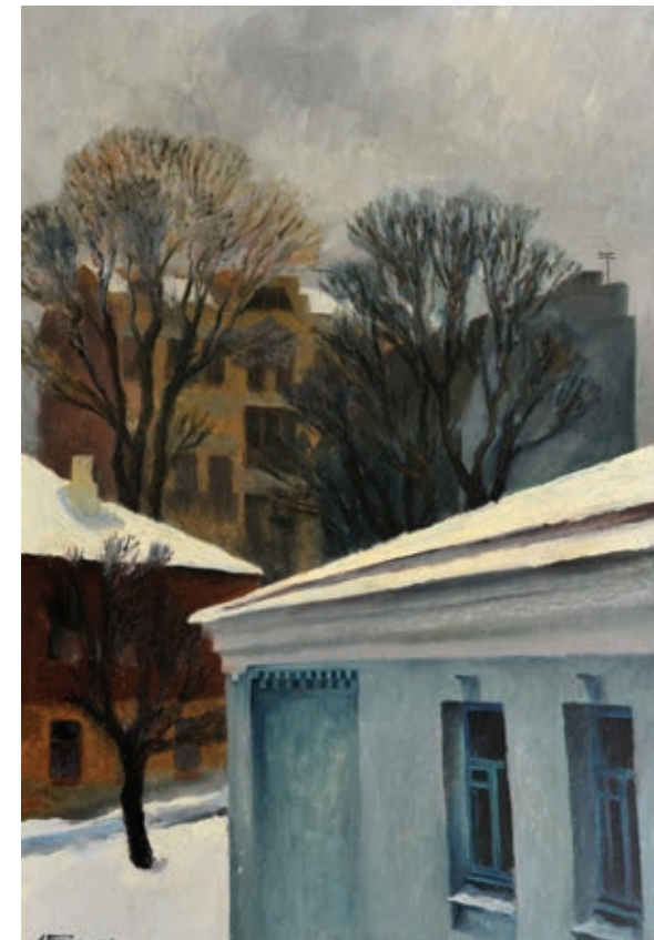
47 «Будинки старого Києва», 1976 Картон, олія 50 x 70 см Підпис і дата знизу ліворуч