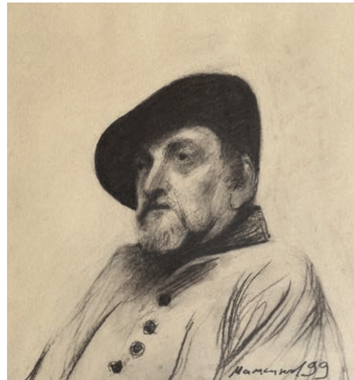
5 «Портрет заслуженого художника України А. Постоюка», 1999 Папір, сепія 48 x 46 см Підпис і дата знизу праворуч