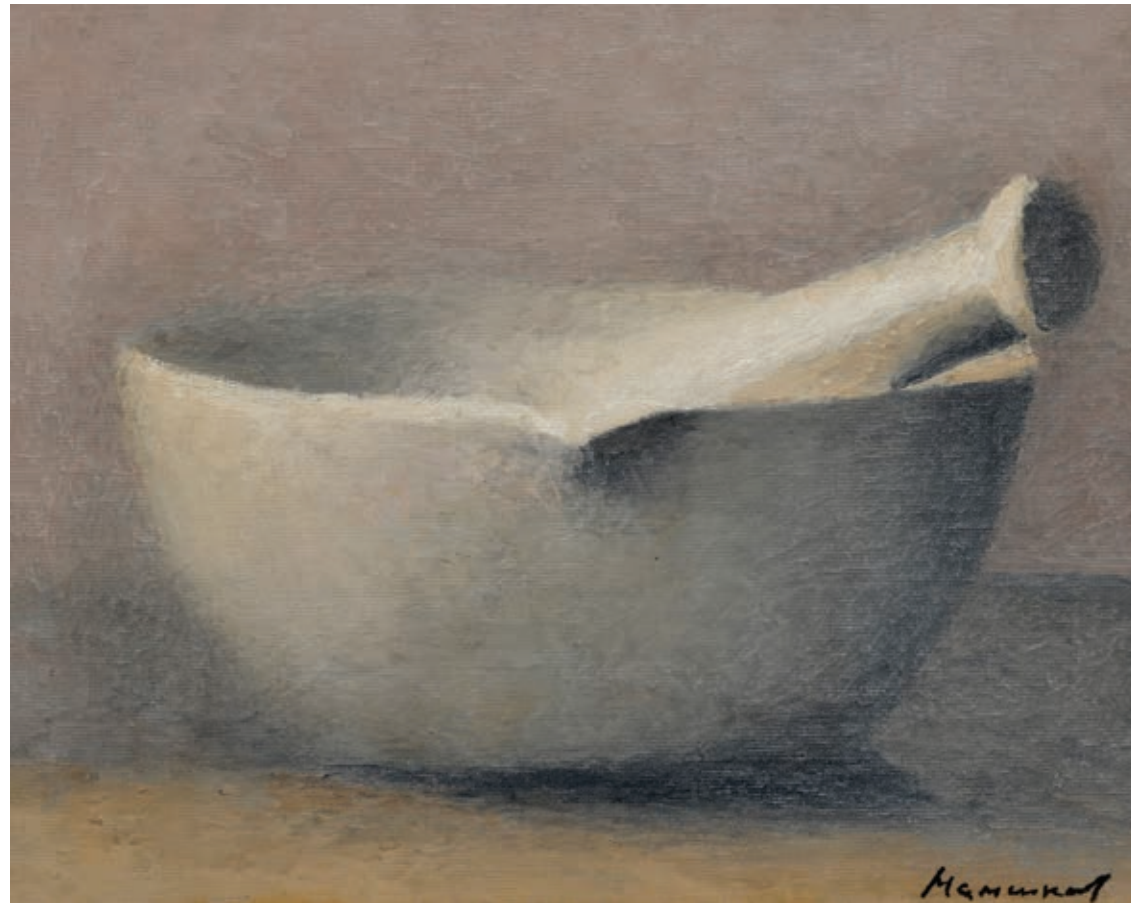
17 «Курант», 2006 Полотно, олія 40 x 50 см Підпис знизу праворуч