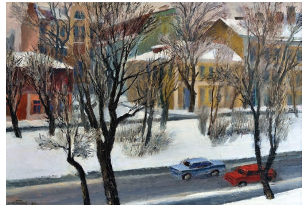
33 «Вулицями Києва», 1987 Полотно, олія 35 x 50 см Підпис і дата знизу ліворуч