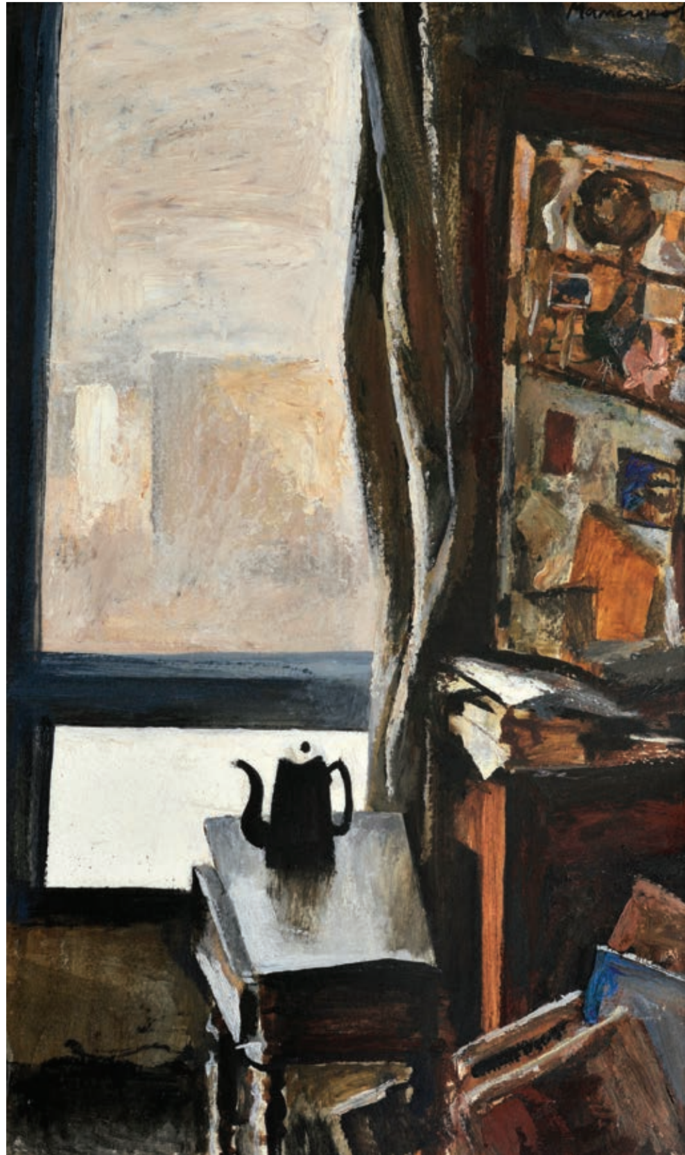
14 «Вікно в майстерні», 1980-і Картон, олія 80 x 50 см Підпис зверху праворуч

"Window in the studio", 1980s Oil on cardboard 80 x 50 cm Signature top right