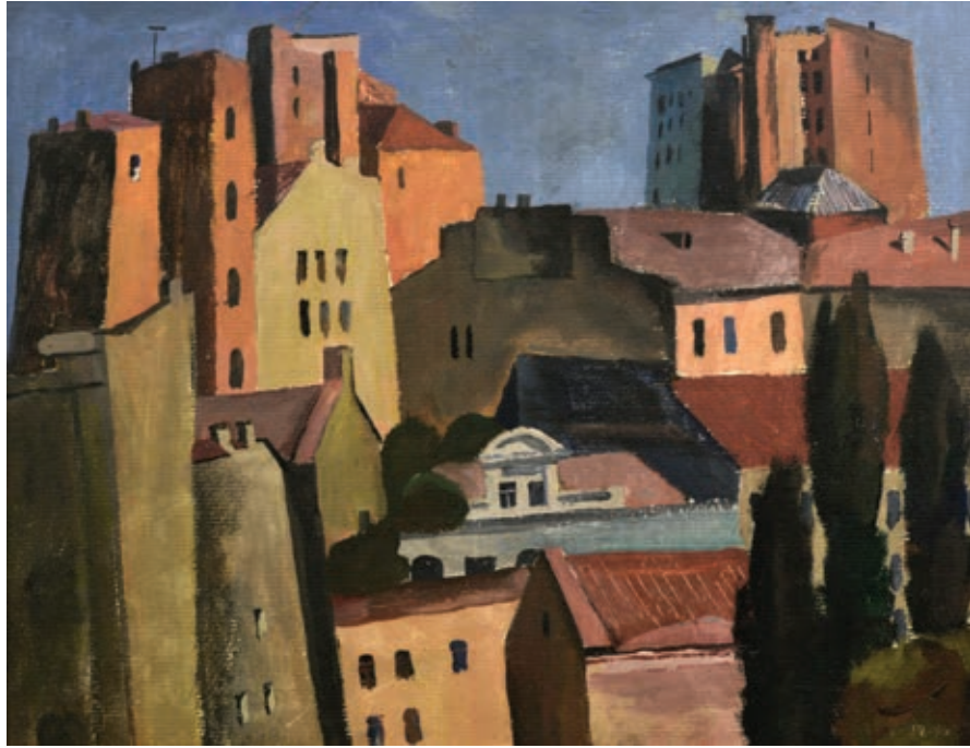
28 «Старий Київ», 1974 Картон, олія 39 x 49 см Підпис і дата знизу праворуч