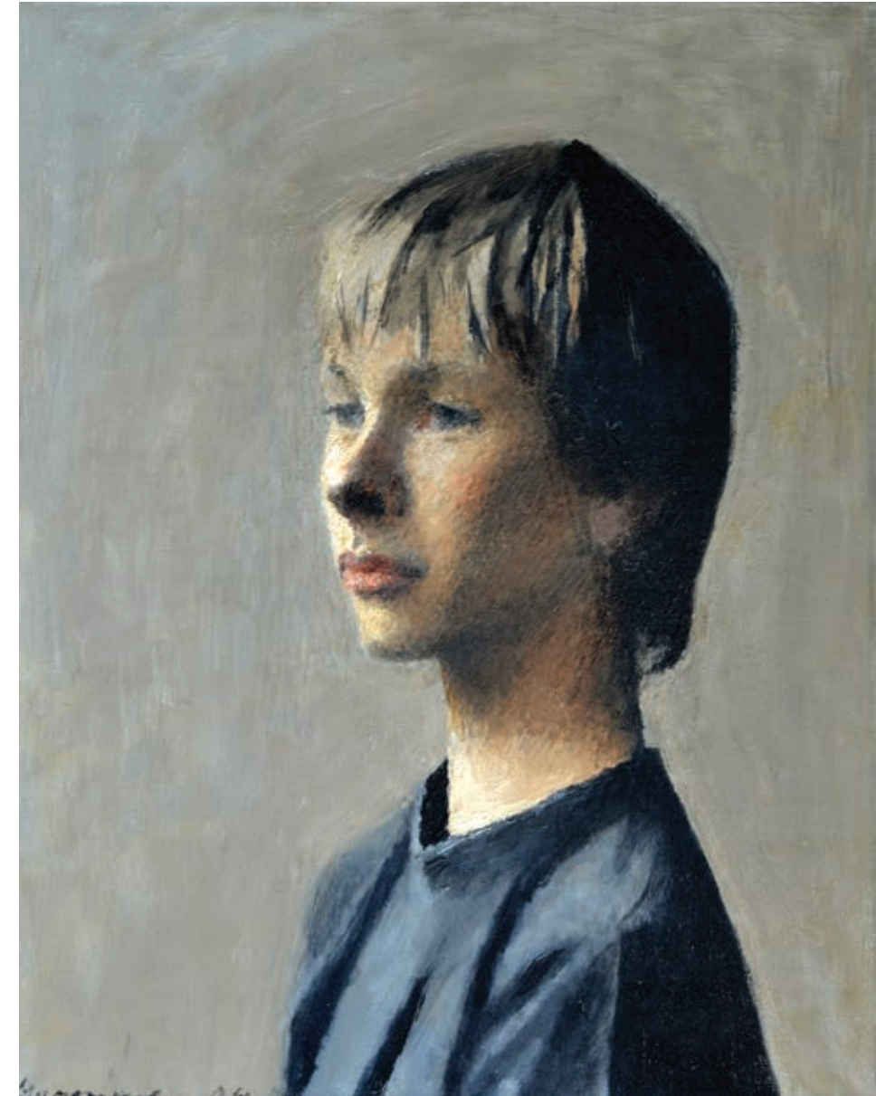
3 «Антон», 2004 Полотно, олія 40 x 50 см Підпис і дата знизу ліворуч