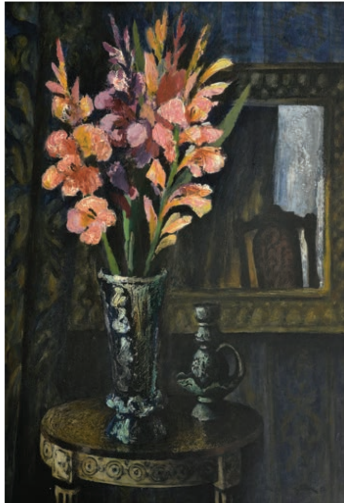
39 «Інтер'єр. Вечір», 1973 Полотно, олія 70 x 50 см Підпис і дата знизу праворуч